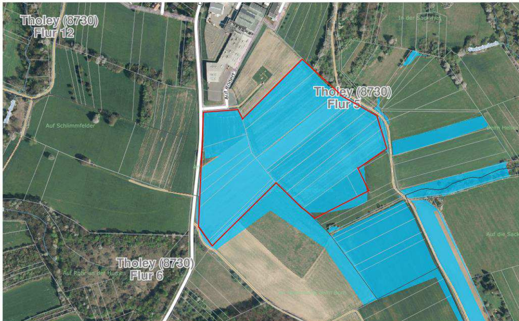
Abb. 1: Lage der Vorhabensfläche (rote Abgrenzung).

Die Firma ON Energy GmbH, Dortmund, beabsichtigt die Errichtung einer PV-Anlage im Bereich der Gemeinde Tholey zu realisieren (Abbildung 1).